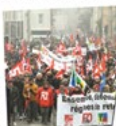
Fortes mobilisations des salariés précaires

« Q u'en 2019, l'unité de FO est essentielle à 20 le gouvernement a beau essayer de séparer les travailleurs et les générations, la force de la confédération s'est de rassembler tous les salariés, en privé et en public, pour faire face à la dégradation des conditions de travail... »